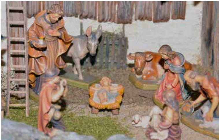
Weihnachten, das Fest der Menschlichkeit und Nähe