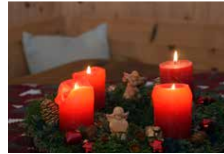
Advent - Besinnung, Brauchtum, Hoffnung, Lichter

www.pfarreiauer-parrocchiadiora.jimdofree.com