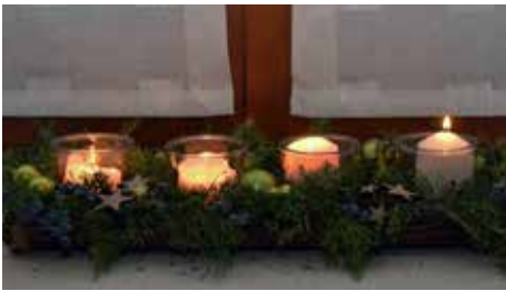
Avvento: riflessione, usanze, speranza, luci

Dieses Gespräch hat mir geholfen, das Geheimnis von Weihnachten von einer anderen Seite her zu betrachten. Gott wird Mensch, um uns zu helfen, einander nahezukommen. Es braucht Sympathie und Empathie; die Fähigkeit, sich in den anderen hinein zu versetzen. Das brauchen wir in all unseren Beziehungen. Das brauchen wir für die Ukraine und für den furchtbaren Krieg im Heiligen Land. Nicht kalt sein, nicht sich einfach heraushalten, nicht distanziert sein, nicht nur um sich selbst kreisen. Gott wird Mensch, weil er uns helfen möchte, einander nahezukommen und menschlich zu sein und zu bleiben. »Ein gesegnetes, lichtreiches Weihnachtsfest Ihnen allen.«