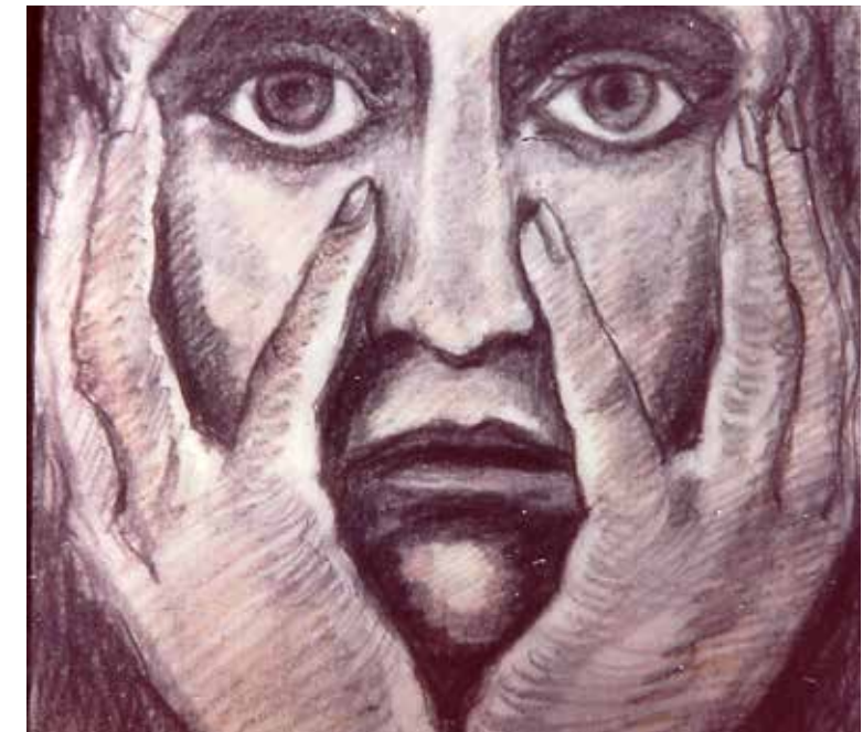
»Herr, mach uns auf!« Grafik S. Grän, 1984 (Bergmoser + Höller Verlag, Aachen)

Die Jungfrauen, die bereit waren, gingen mit ihm in den Hochzeitssaal und die Tür wurde zugeschlossen. Später kamen auch die anderen Jungfrauen und riefen: Herr, Herr, mach uns auf! Er aber antwortete ihnen und sprach: Amen, ich sage euch: Ich kenne euch nicht. Seid also wachsam! Denn ihr wisst weder den Tag noch die Stunde.