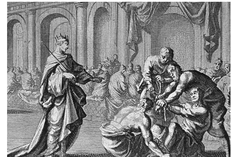
Der Gast ohne Feiertag (Kupferstich von J. Luyken, 1729)