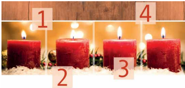
Besinnlicher Advent für Familien