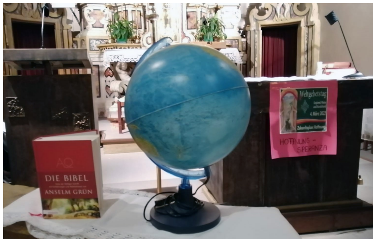
Weltgebetstag rund um den Erdball